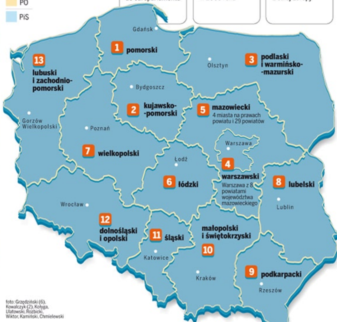
foto: Grzędziński (6), Kowalczyk (2), Kołyga, Ulatowski, Rozbicki, Wiktor, Kamiński, Chmielewski